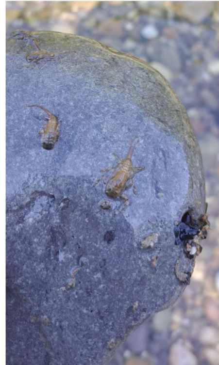
Abbildung 2: Eintagsfliegenlarven Emme